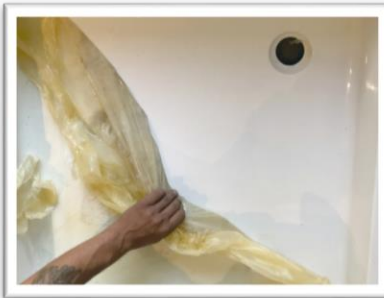
VERWIJDEREN VAN DE BESCHERMFILM