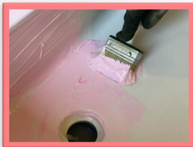
AANBRENGEN VAN MASK

Tijdelijke beschermfolie voor industrie en bouw. Enkel geschikt voor binnengebruik.